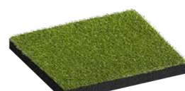
Rubberflex™ XTR Turf