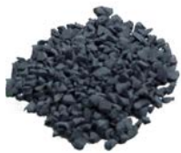
Black base SBR