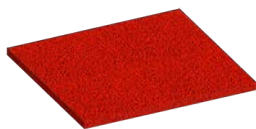
Rubberflex™ XTR 6