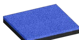
Rubberflex™ XTR 12+6